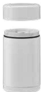
EOS WM EOS WM MULTI

EOS WM per colonna a luce fissa EOS WM MULTI per colonna a luce lampeggiante