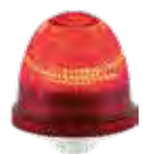
OVOLUX R LED